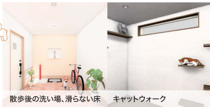
散歩後の洗い場、滑らない床

定年退職後にペットを飼い始めるという方も多いものです。床板を滑らないものにしてみたり、キャットウォークを作ってみたり、ワンちゃんやネコちゃんと快適な生活を送る為のリフォームも考えてみてはいかがでしょうか。